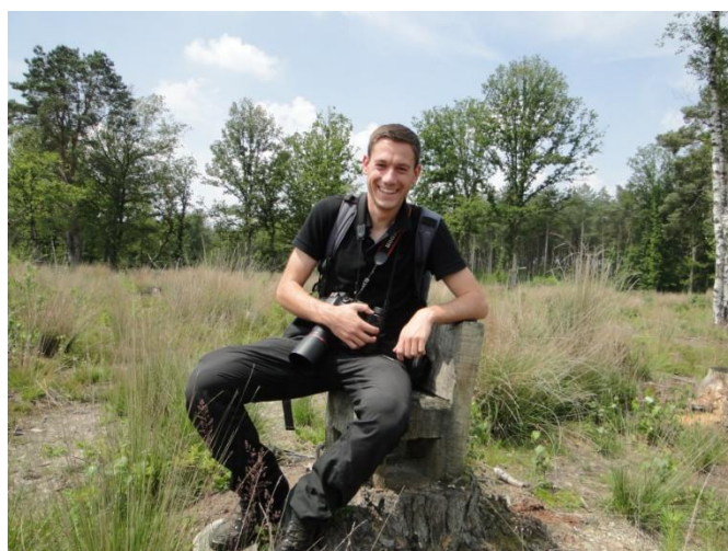
Kabouter Pieter was ook van de partij