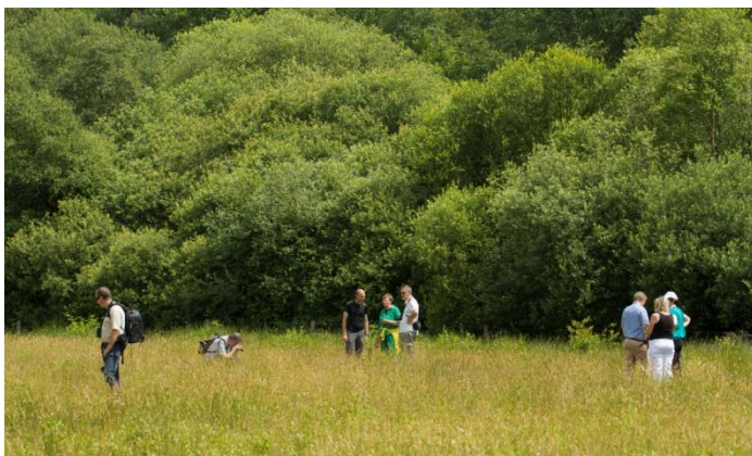
Een aantal deelnemers en de gids